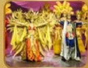
ชมการแสดงละครจีน