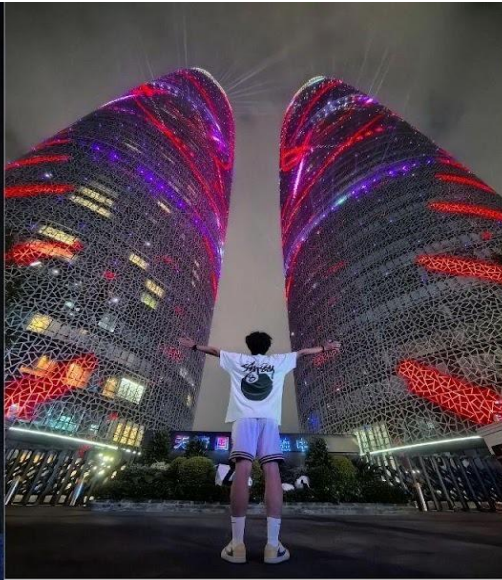
ตึกแฝดเทียนฟู่ (Tianfu International Financial Center Towers)