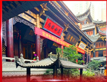
วอพรวัดหลัวจัน ฉงซิ่ง