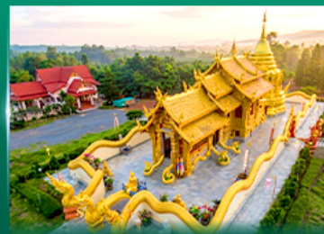
วัดเทพอินทรประดิษฐ์