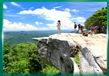
จุดชมวิวดาสุตาแผ่นดิน