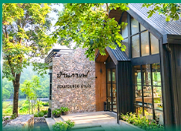
ร้านค้าอพ สวนสวย 168