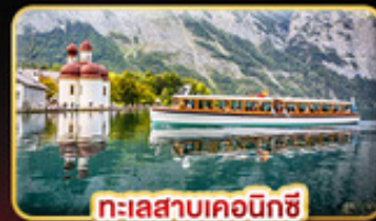
ทะเลสาบเคอนิกซี