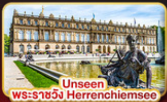
Unseen พระราชวัง Herrenchiemsee