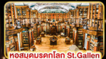
หอสมุดนครค็อล St.Gallen