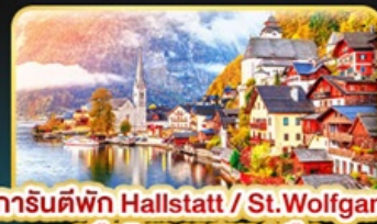
การันตีพัก Hallstatt / St. Wolfgang หรือริมนทะเลสาบ 1 คืน