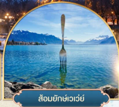
ล้อมยักซ์เวอว์