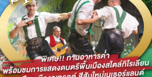
พิเศษ!! ทานอาหารค่ำ พร้อมชมการแสดงดนตรีพื้นเมืองสไตส์ทีโรเลียน และเยือนเมืองอูเทรคต์ สีสันใหม่เนเธอร์แลนด์

ไฮไลท์โปรแกรม • เยือนเมืองแห่งแคว้นบาวาเรีย และ ทีโรล • สุกสนานเหมืองเกลือเบิร์ชเทสกาเดิน • เข้าชมปราสาทนอยชวานสไตน์ • เดินเล่นจัตุรัสโรเมอร์ ซ็อบปีง Zeil Street • ถ่ายรูปมุมสวยของหมู่บ้านอัลสติก • ซิลลา ไปในเมืองซาลสบูร์ก บ้านเกิดโมสาร์ท 25 ก.ย. - 04 ต.ค. 69 • ล่องเรือหมู่บ้านทีรูร์น และ ล่องเรือชมนครอัมสเตอร์ดัม 09-18, 16-25 ต.ค. 69 • ซ็อบปีงจุ้ย่านดิมสแควร์และเดินเล่นย่านโคมแดง 22-31 ต.ค. 69 / 06-15 พ.ย. 69 GO3MUC-TG032 29 ธ.ค. 69 - 07 ม.ค. 70 * ปีใหม่ *