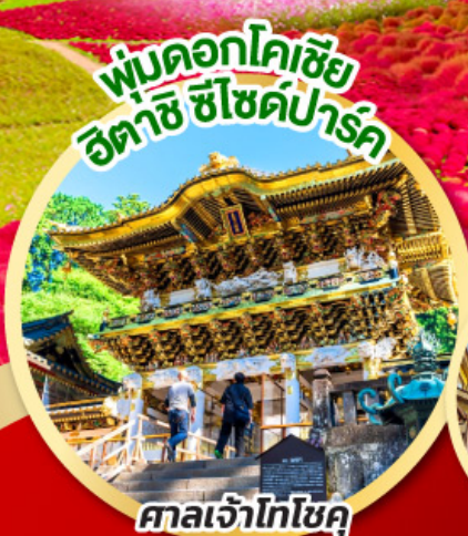
พุ่มดอกโคชิชิ ฮิตาชิ ฮิซึคิพาร์ค