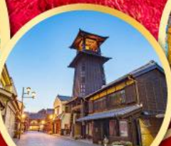
ลิตเติลเอโดะ เมืองควาโกเอะ