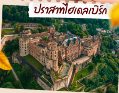
ปราสาทฮาเดบวร์ค