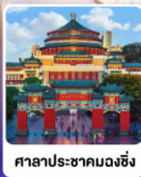
ศาลาประชาคมดงซิ่ง