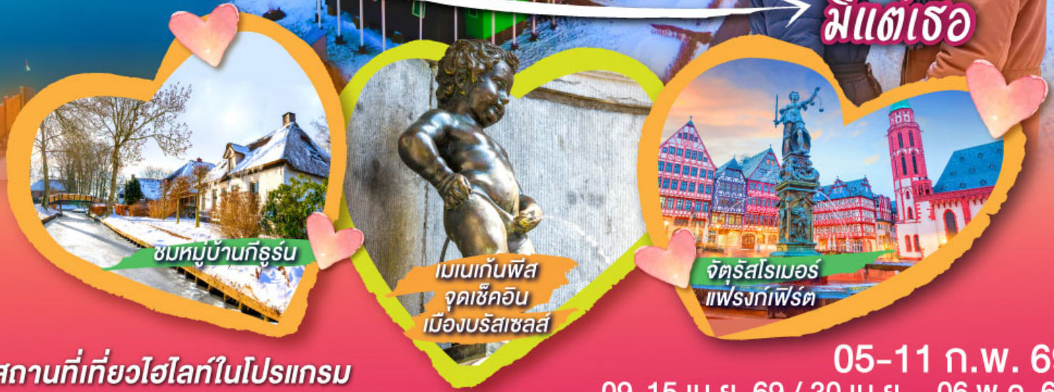
ชมหมู่บ้านกังหัน