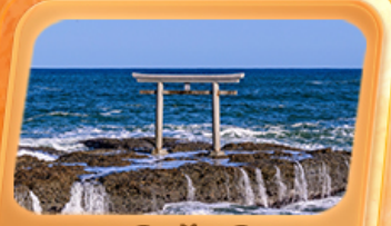
ศาลเจ้าโองาโระอิซซากิ

แพคเกจใกล้ชิด "ฟูจิซัง" ที่หมู่บ้านโอชิโนะ อักโท สวนโออิชิปาร์ค ที่เที่ยว Unseen นั่งกระเช้าชมวิวภูเขาฟูจิ ทะเลเจ้าโองาโระอิซซากิ เสาโทริอิริมทะเล อลังการโบสถ์เปลี่ยนสี น้ำตกเคงอน ศาลเจ้านิกโกโทโชกุ เสรียมมงคล วัดพระใหญ่ซึคุ ไดบุทสึ ห้ามพลาดโคมแดงยักษ์ วัดอาซากุสะ อิมมอร์ทัลตลาดปลาโทโยสุ ภัตตาคารแนว 3D ย่านชิจูกุ ซุปบิงจูกุย่านดังชิบูย่า