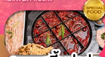
มือพิเศษ สุกี้หม่าล่า