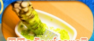
พิพิธภัณฑที่วาซาบี เดินทาง พ.ศ. 69 เป็นต้นไป