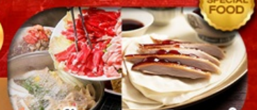
เมนูสุกั่มองโก + เปิดปักกิ่ง เดินทาง เม.ษ. - ต.ค. 69