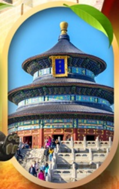
หอสังเกตการณ์เทียนถาน