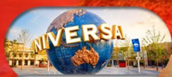
อิสระฟรีเดย์ 1 วัน หรือเลือกซื้อทัวร์เสริม US