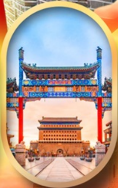
ถนนคนเดินเจียนเหมิน