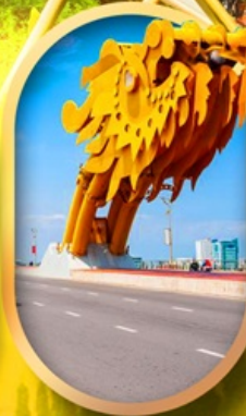
สะพานมังกรดานัง