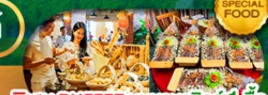
SPECIAL FOOD พิเศษ BUFFET; บันบานาฮิลล์ 1 มื้อ และ SEAFOOD BOAT เดินทาง มี.ค. - ต.ค. 69