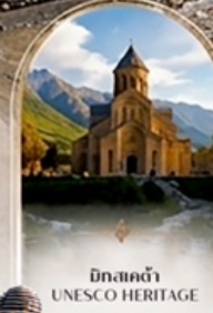
มิกลคด้า UNESCO HERITAGE