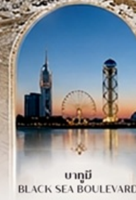
บาทุบี BLACK SEA BOULEVARD