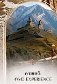
คาสเบกี 4WD EXPERIENCE