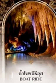
ดำโพรมิริอัส BOAT RIDE

เดินทางช่วงปีใหม่ 27 ธ.ค. - 3 ม.ค. 70 ราคาเพียง 75,989 บาท / ท่าน