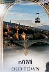
ทบิลีซี OLD TOWN