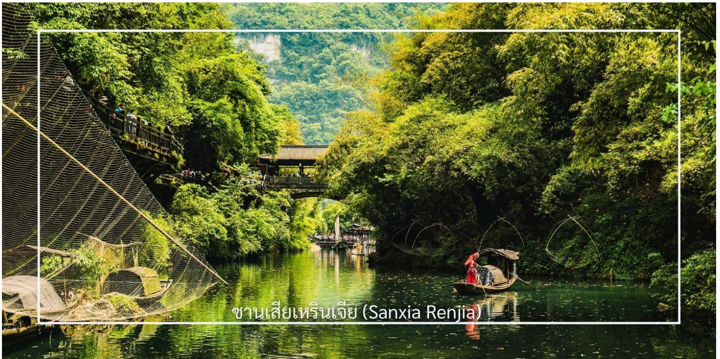
ซานเซียเหรินเจีย (Sanxia Renjia)

นำท่านสู่ หมู่บ้านซานเซียเหรินเจีย (Sanxia Renjia) (รวมล่องเรือ) สถานที่นี้เป็นที่รู้จักกันในชื่อ หมู่บ้านสามผา แหล่งท่องเที่ยวระดับ 5A ตั้งอยู่ในเขตหุบเขาสามผา ริมแม่น้ำแยงซีเกียง โดดเด่นด้วยทัศนียภาพทางธรรมชาติอันงดงามของภูเขา หินผา สายน้ำ และหุบเขาที่โอบล้อมกันอย่างกลมกลืน สถานที่แห่งนี้สะท้อนวิถีชีวิตดั้งเดิมของชาวลุ่มแม่น้ำแยงซีเกียง ผ่านสถาปัตยกรรมพื้นบ้าน วัฒนธรรม ประเพณี ที่ยังคงเอกลักษณ์ไว้อย่างครบถ้วน พร้อมให้ท่านได้ชมการแสดงเรื่องราวเกี่ยวกับวิถีชีวิตควบคู่กับสายน้ำ