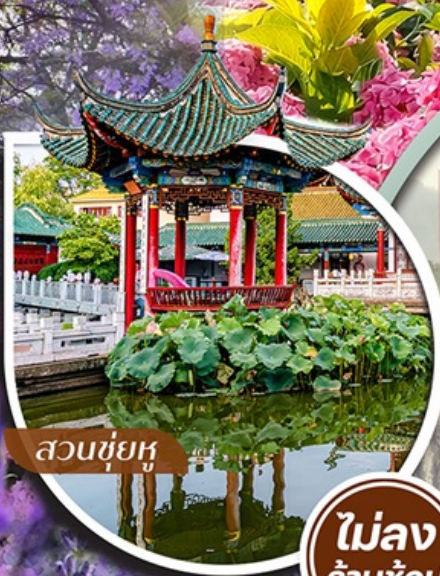
สวนชู่ยู่