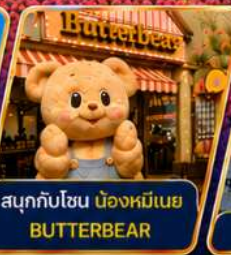
สนุกกับโซน น่องหมีเนย BUTTERBEAR