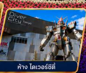
ห้าง ไดเวอร์ซิตี