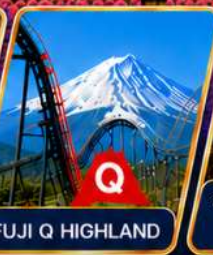
FUJI Q HIGHLAND