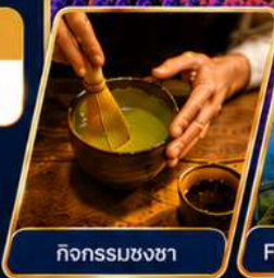
กิจกรรมชงชา