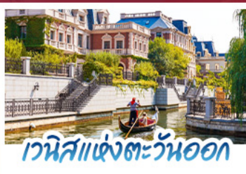
เวนิสแห่งตะวันออก