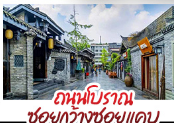
ถนนโบราณ ชอยกว้างชอยแคบ