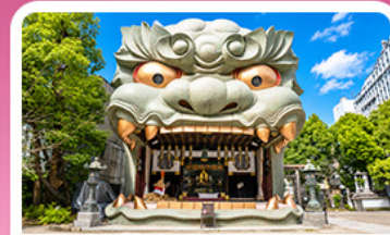
ศาลเจ้านัมมะ ยาสากะ