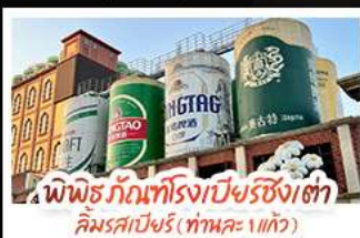
พิพิธภัณฑ์โรงเบียร์ชิงเต่า คิมรตเปียงริ (ทานคะ 1 แก้ว)