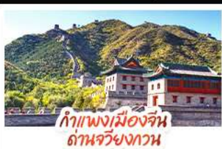
กำแพงเมืองจีน ด่านจวิ้นกวน

ส่องเรือสุดโรแมนติกแม่น้ำหวงผู้ ปักกิ่ง...เปิดประตูสู่แดนมังกร ด้วยความอลังการระดับจักรพรรดิ ชิงเต่า...เมืองชายทะเลสไตล์ยุโรป หอระฆังแบบฟ่อนคลาย เซี่ยงไฮ้...มหานครแห่งเอเชีย เมืองที่ไม่เคยหลับใหล