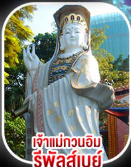
เจ้าแม่กวนอิม รีฟลัสส์เบย์