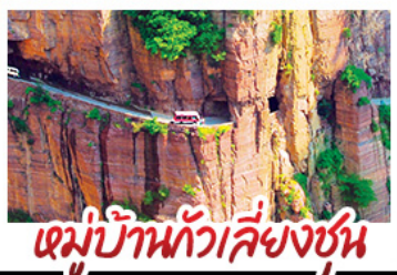
หมู่บ้านทิวเลียงซุม