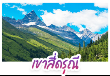
เขาสี่ดรุณี