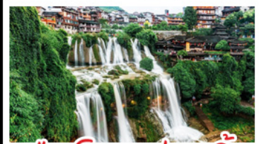
เมืองโบราณผุ่ตรงเงิน