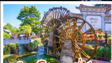
เมืองโบราณสี่เจียง