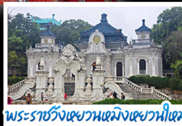
พระราชวังหยวนเหมิงหยวน