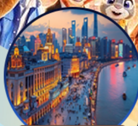
หาดไต้หวัน

สนุกจุใจ เชียงไฮ้ ดิสนีย์แลนด์ ฟรีเดย์ 1 วัน