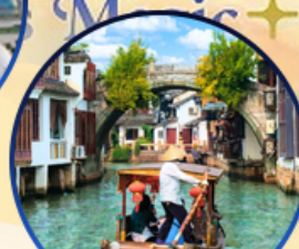
เมืองโบราณจูเจียเจีย