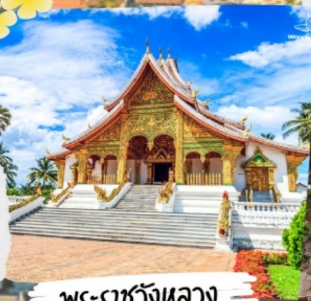
พระราชวังหลวง