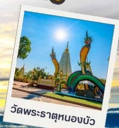
วัดพระธาตุหนองบัว