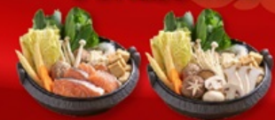
สุกี้ปลาแซลมอน+สุกี้เห็ด