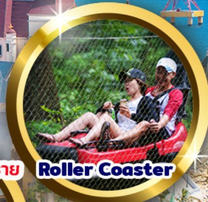
สุดว้าว!! นั่งรถจี๊ปตะลุยทะเลทราย Roller Coaster