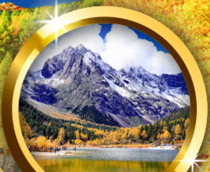
อุทยานปีเผิงโกว