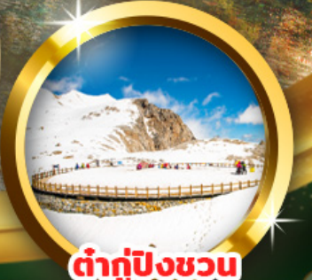
ต่ากู่ปิงชว่น