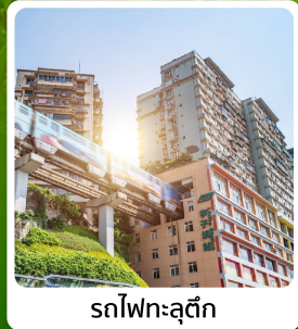
รถไฟทะเลสุดคึก

ไฮไลท์! เมืองโบราณกงถาน ล่องเรือแม่น้ำจูเจียง อุกยานถาฮวาหยอน รถไฟทะเลสุดคึก หมู่บ้านโบราณฉือชี่ซิว ถนนคนเดินเจียงฟางเปี่ย