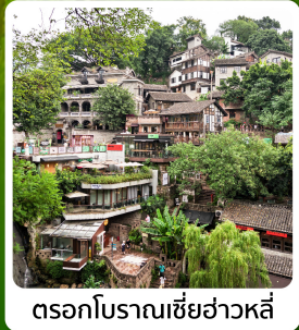
ตรอกโบราณเขี่ยฮ่าวหลี่