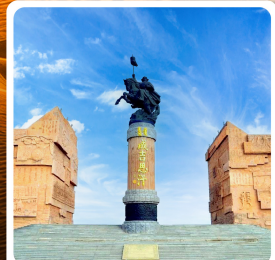
เขตท่องเที่ยวเจงกีสข่าน