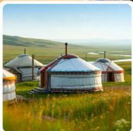
ที่พักแบบกระโจม