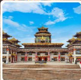
ทำเนียบพระลามะอูหลาน