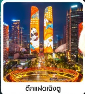
ตึกแฝดเจิงตู