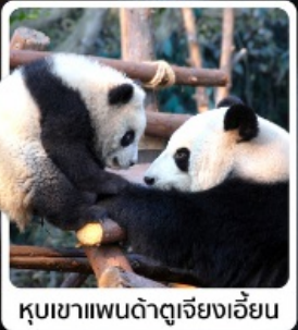
หุบเขาแพนด้าดูเจียงเอี้ยน