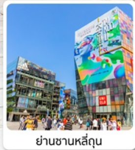
ย่านชานหลี่ถุน

ไฮไลท์! ชมอารยธรรมสุดยิ่งใหญ่ พระราชวังต้องห้ามถูกชม 1 ใน 7 สิ่งมหัศจรรย์ของโลก กำแพงเมืองจีน