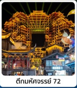
ตีทมหัตจอร์รี่ 72