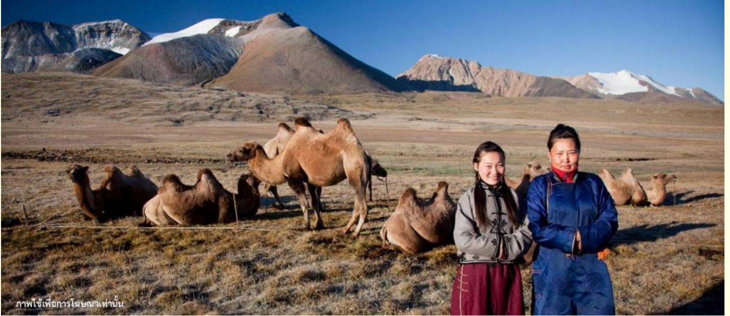
ภาพใช้เพื่อการโฆษณาเท่านั้น

นำท่านร่วมกิจกรรม พิธีต้อนรับแขกสไตล์มองโกล เป็นประเพณีโบราณที่มีมาช้านาน ชาวมองโกลมีอุปนิสัยที่รักเพื่อนฝูงและตรงไปตรงมาไม่เสแสร้ง เมื่อมีเพื่อนหรือแขกมาเยือนก็มักจะผูกมิตรอย่างจริงจัง และนำท่านร่วมกิจกรรม สวมใส่ชุดมองโกล สัมผัสพลังแห่งบรรพบุรุษ สวมเสื้อคลุมแบบดั้งเดิมที่มีสีสันสดใส ปักลวดลายอันประณีต คุณจะสัมผัสได้ถึงพลังแห่งบรรพบุรุษที่เคยปกครองดินแดนครึ่งโลก การสวมหมวกขนสัตว์ ผูกสายรัดเอว พร้อมเครื่องประดับเงินแท้ที่ส่องแสงระยิบระยับ จะทำให้ท่านเสมือนกลายเป็นนักรบแห่งทุ่งหญ้า พร้อมเครื่องประดับเงินแท้ที่ส่องแสงระยิบระยับ ของชนเผ่าที่เคยปกครองดินแดนครึ่งโลก เมื่อคุณยืนท่ามกลางทุ่งหญ้าไร้ขอบเขต