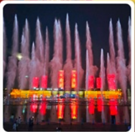
น้ำพุคังปายี

• ไซโล่ เป็นทรายเสียงซาวาน แหล่งท่องเที่ยวระดับ 5A ของจีน ภูเขาไฟอุลันฮาตา น้ำพุคังปายี น้ำพุที่สูงที่สุดในเอเชีย