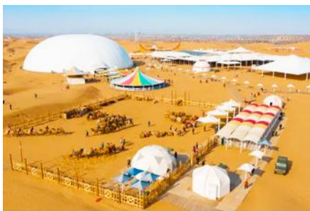
เกาะกลางทะเลทรายเซียนซาเต๋า