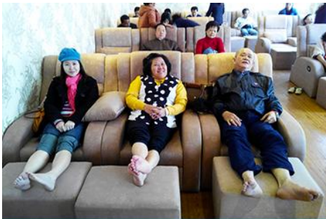
ศูนย์วิจัยแพทยแผนจีน