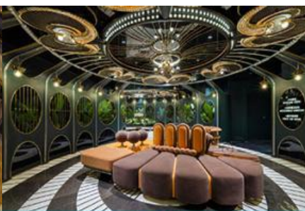
ห้องน้ำไอเทค