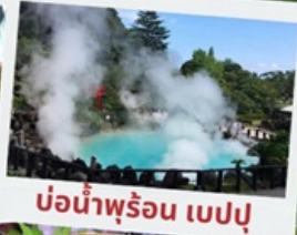
บ่อน้ำพุร้อน เปรปุ

หมู่บ้านยูฟูอินฟลอร์ริล ทะเลสาบคินริน ทะเลสาปคินริน บ่อน้ำพุร้อน อุมิจิโกกุ ท่าเรือโมจิโกะ เรโร ตลาดปลาคาราโตะ ศาลเจ้ามียาจิดาเกะ ดิวตี้ฟรี ฟุกุโอกะ เบย์ พลาซ่า ช้อปปิ้งออน มอลล์ หินคู่เมโอโตะอิวะ ชมดอกไม้ไฮเดรนเยีย รอบน้ำตกชิราอิโตะ ช้อปปิ้งย่านเท็นจิน